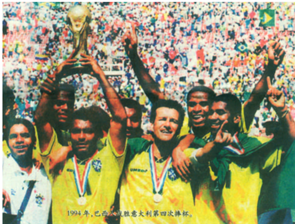
1994年，巴西队战胜意大利第四次捧杯。

无论世界杯的最后结果会怎样，我们都坚信那将是一个美丽的结局。在各路豪强即将角逐大力神杯的前夕，让我们共同期待着，期待那个美妙而又神奇的六月。