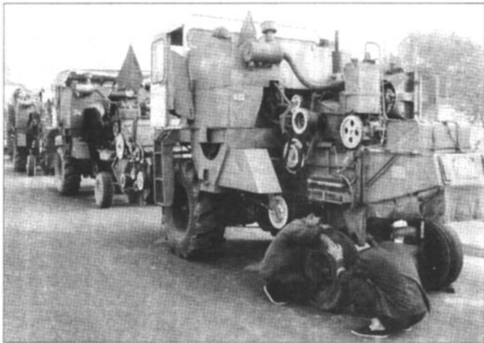
夏收将至,“麦客”们开着大型收割机,又开始了新一轮的南下征程。图为来自河北省内丘县的一个收割机队正在107国道河南省新乡段检修车辆,准备赴河南驻马店地区收割小麦。

据了解,国际政要、世界著名权威人士和世界500强首脑、金融、证券界人士在“科博会”上演讲内容将涉及当前全球高新技术及相关领域的最新热点:WTO与21世纪中国经济、金融创新与中国企业融资上市、如何引用国外风险投资发展中国的高新技术产业、最新生物技术及其产业化发展现状与前景展望、信息不对称理论、信息时代与政府信息化、软件业发展、干细胞生物学医学展望等。