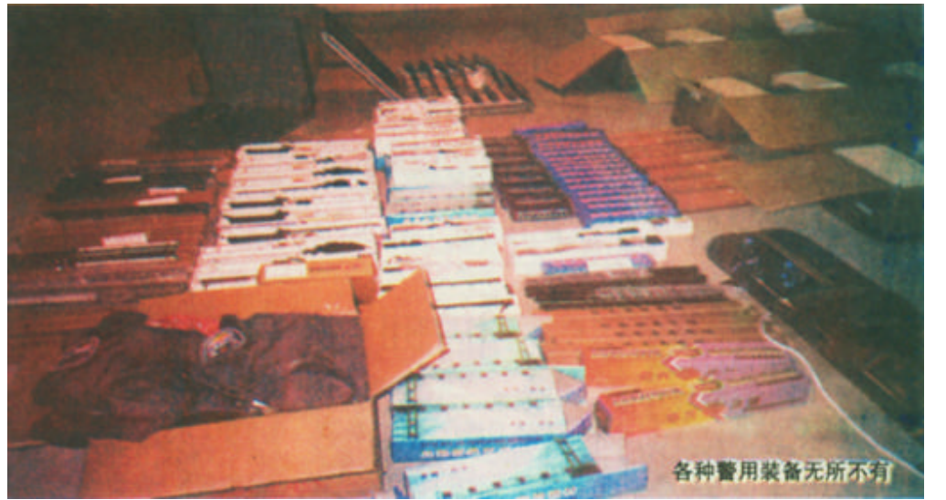
各种警用装备无所不有

长期以来,正对西城商河路小商品城的马路卫生问题十分严重,本报亦多次予以关注,有关部门也严加整治,以往污水横流、垃圾满堆的现象大有改观。但近日记者在此繁华地段看到,在一长排垃圾箱前边,小吃货车依然生意兴隆,距此不足五六米处,就有一公共厕所。随着天气渐热,蚊蝇滋生,小吃卫生是个问题。希望继续加大整治力度,还市民一个良好的公共环境。