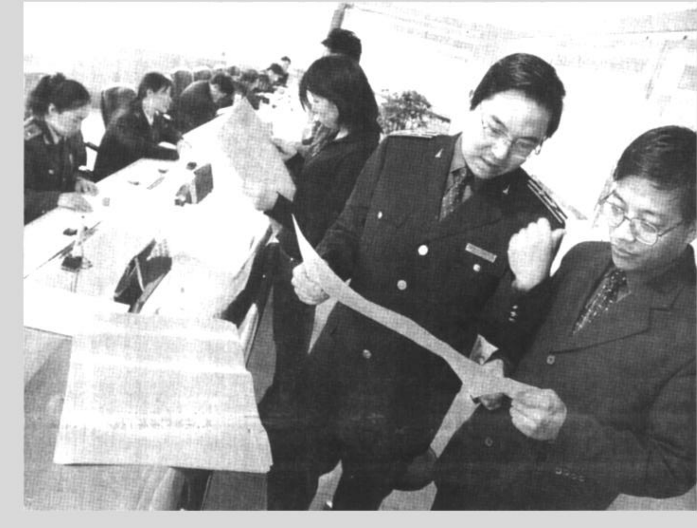
市质量监督局河口分局不断强化服务功能，将各项服务内容、限时办结要求、对工作人员服务要求等，一一打印成明白纸，让业户监督执行，受到业户的赞誉。

本报讯 近日，市农业局领导班子来到所包村利津县陈庄镇薄扣村现场办公，落实帮扶项目，解决包扶村经济发展中的困难。为切实做好帮扶工作，市农业局派出最优秀的干部驻村帮扶，多次召开专题会议研究帮扶工作。局班子一行实地查看了村容村貌、土地利用现状，针对薄扣村经济发展中存在的问题进行了讨论。确定帮扶工作的重点是帮助群众解放思想，更新观念，选准致富路子，在帮助改善生产条件、生活环境的前提下，突出做好科技帮扶、智力帮扶，实现村经济持续、健康发展。针对村经济发展中存在的问题，突出做好八项帮扶工作。一是修建村内柏油路，改善村民生活环境，提高村民生活质量，解决村民行路难的问题；二是开发村周围600亩荒地，改善村民的生产条件，有效解决人多地少、土地质量差，土地产出低的问题；三是建设100亩冬枣示范园，配套完善50亩拱棚西瓜示范园，200亩抗虫棉示范园，40个庭院蔬菜大棚，引导农民调整优化种植业结构，大力发展高效经济作物，形成以棉花、冬枣、拱棚西瓜、保护地蔬菜等经济作物种植为主的高产高效专业村；四是扶持沼气池建设为纽带，引导群众大力发展畜牧业和无公害农产品生产，实现农牧结合，建成牧一沼一园生态富民家园；五是文化大院配套科技图书，在薄扣村率先建立村级农民科技书屋，构建引导科学，学习文化，反对迷信的精神文明阵地；六是在薄扣村设立市农业局驻薄扣村农业科技指导站，建立村民科技培训学校，配套必要音像教学设施，定期选派局农技人员到村进行技术指导授课，提高群众的科技文化素质；七是采取优惠政策，积极鼓励农村劳动力由农业向非农业转移，大力发展个体私营经济，开展多种经营，培植工、商、副、农等勤劳致富典型，带动全村经济发展，提高村经济整体水平；八是实施帮扶联户活动，班子成员、科室及下属单位负责帮扶一个专业户、贫困户或贫困学生，帮助群众脱贫致富奔小康。（本报记者）