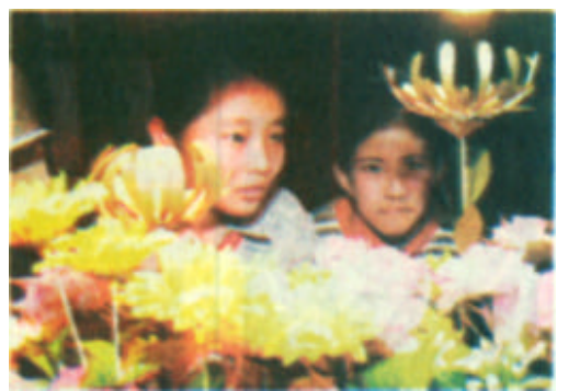
5月13日,以“科技走进生活”为主题的“第八届北京科技周”在北京民族文化宫开幕。这是在科技周活动中,用记忆合金材料制作的“铁树”开花吸引了爱好科技的小朋友。用此种材料做成的花在摄氏65度以上便能自动开放。

新闻热线 8328691 8331392 电子信箱 dyrb@sina.com 网址 http://www.dyrb.com 2002年5月15日 星期三 第50期 总第2708期 全国统一刊号 CN37-0054 邮发代号 23-172