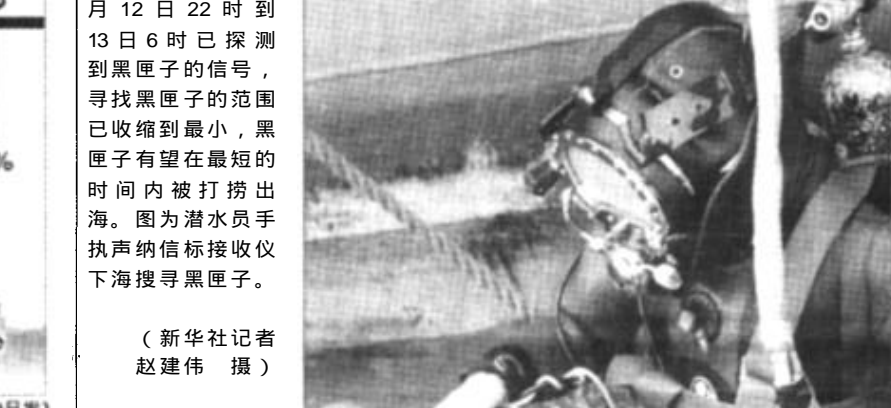
从美国运到“5·7”空难飞机失事地进行探测的声纳接收仪在5月12日22时到13日6时已探到黑匣子的信号,寻找黑匣子的范围已缩小到最小,黑匣子有望在最短的时间内被打捞出海。图为潜水员手持声纳接收仪下海搜寻黑匣子。

新版5年有效港澳通行证正式启用后,凡以旅游为由申请护照或港澳通行证的,不再由旅游部门代办,而采取申请人凭有效经营旅行社的发票,自行到公安出入境管理部门办理申请,旅行社只办旅游签证。