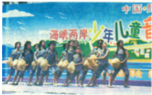
5月13日,来自全国各地共40多个民族的孩子欢聚在福建厦门鼓浪屿,参加海峡两岸少年儿童音乐舞蹈大联欢。这是台北飞舞舞团的少年演员在表演舞蹈《客家茶山风情》。